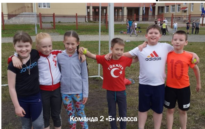
Команда 2 «Б» класса

И вот среди 1-4 классов выявились победители, это те, кто показал лучшие результаты во всех трех состязаниях.