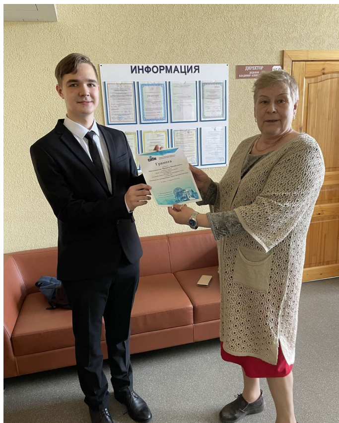
Так держать и на других экзаменах, ребята!