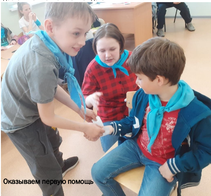
Оказываем первую помощь