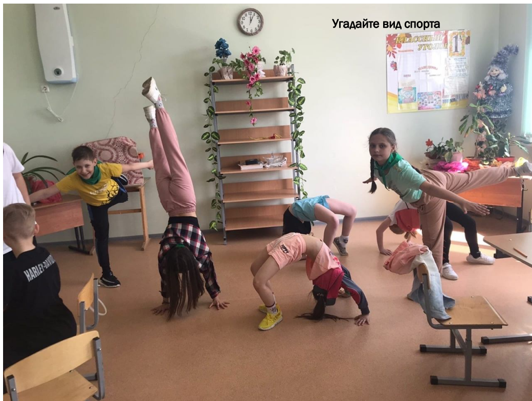
Угадайте вид спорта

Цветотерапия - это метод нетрадиционной медицины,