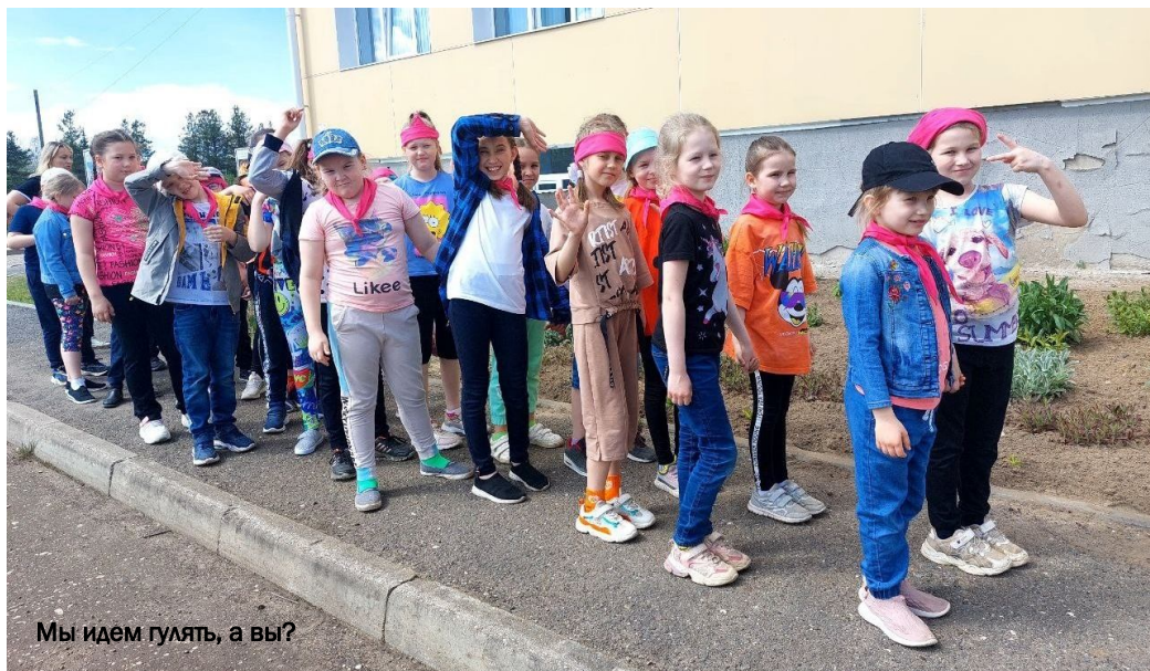
Мы идем гулять, а вы?

1 июня – это не только начало лета, но и Международный день защиты детей . По всей стране в этот день проводятся различные мероприятия. В нашей школе прошёл небольшой концерт, посвященный