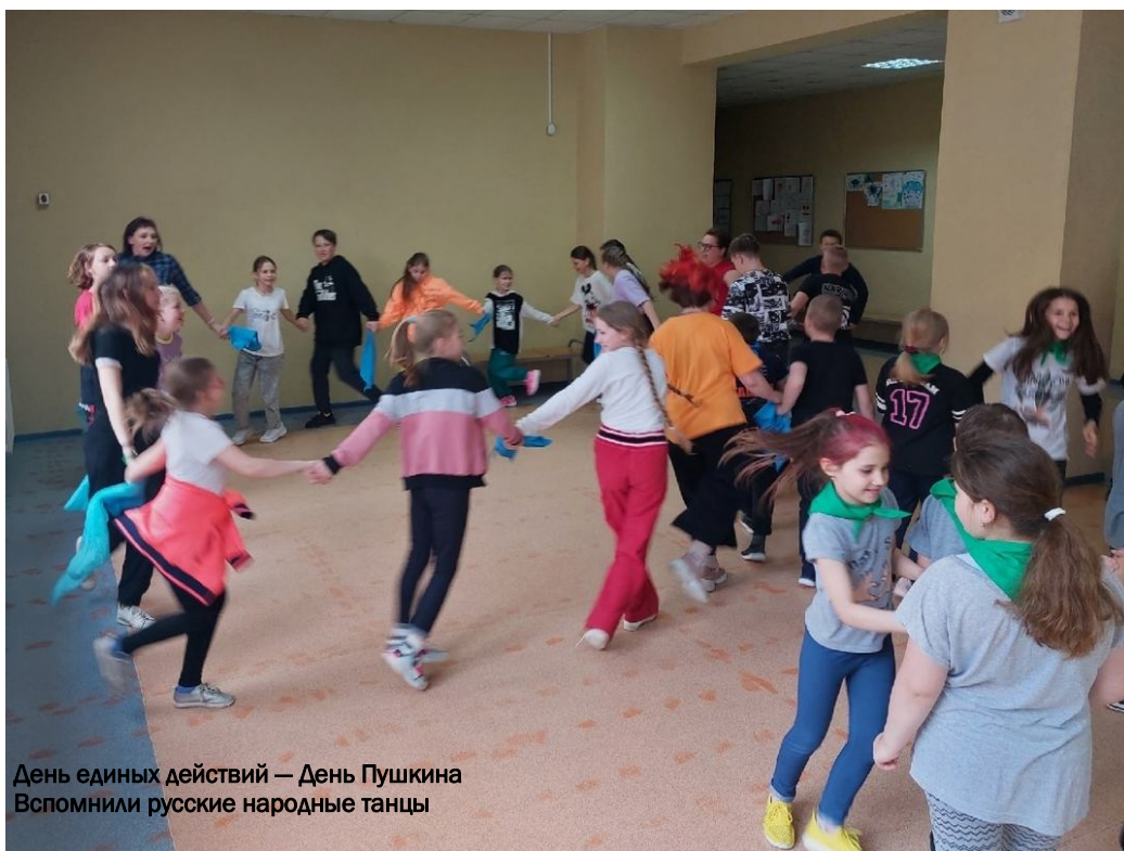
День единых действий — День Пушкина Вспомнили русские народные танцы