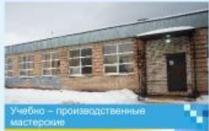
Учебно – производственные мастерские