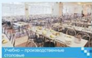
Учебно – производственные столовые