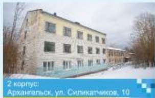
2 корпус: Архангельск, ул. Силкатчиков, 10