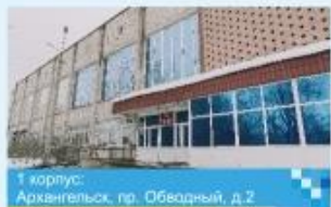
1 корпус: Архангельск, пр. Обводный, д.2